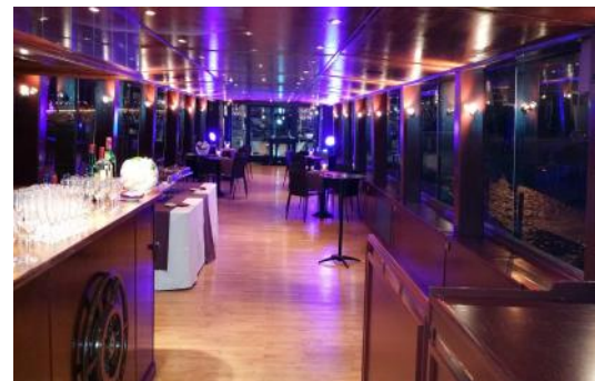
Table d'hôtes (housse en option)